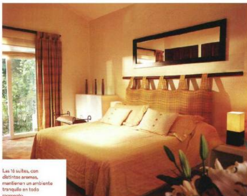
Las 16 suites, con distintos aromas, mantienen un ambiente tranquilo en todo momento.

El hotel, de estilo mediterráneo, fue inaugurado en 2009. El edificio se inspira en pueblos mexicanos del Pacífico y los pueblos blancos de Andalucía, en España. Se localiza al extremo sur de Ixtapa Zihuatanejo, frente al Campo de Golf Robert Trent y a 15 minutos del aeropuerto. Sólo hay dos hoteles de su tipo en México, que ofrecen la talasoterapia.